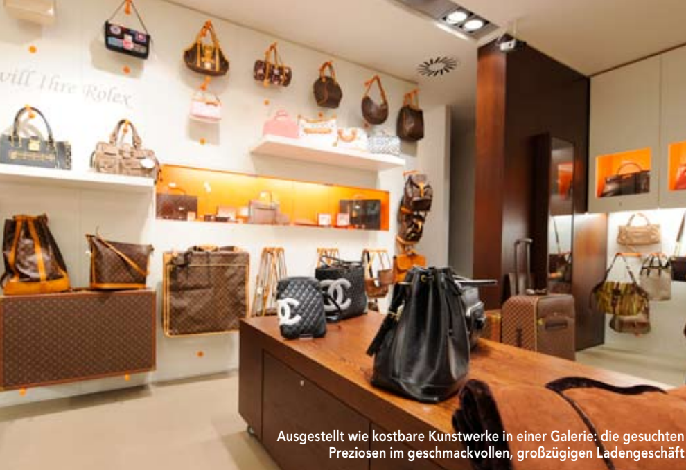
Ausgestellt wie kostbare Kunstwerke in einer Galerie: die gesuchten Preziosen im geschmackvollen, großzügigen Ladengeschäft